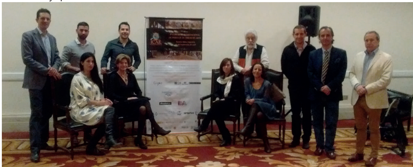
Foto grupal de exponentes y organizadores