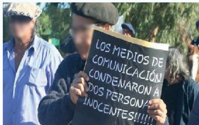
Fig 1: Manifestaciones en contra y a favor de los imputados.