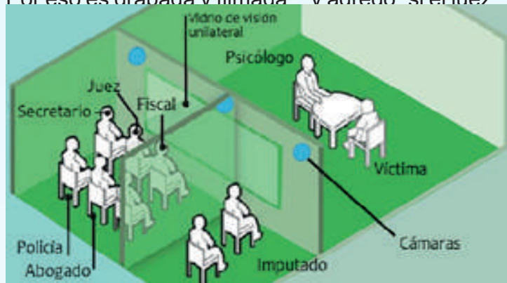
Fig 2: Esquema de cámara gesell.

Lo más importante que recalco Varela es “esta pericia es testimonial significa que no puede ser repetida porque no se puede revictimizar al chico. Por eso es grabada y filmada” y agregó “si el juez